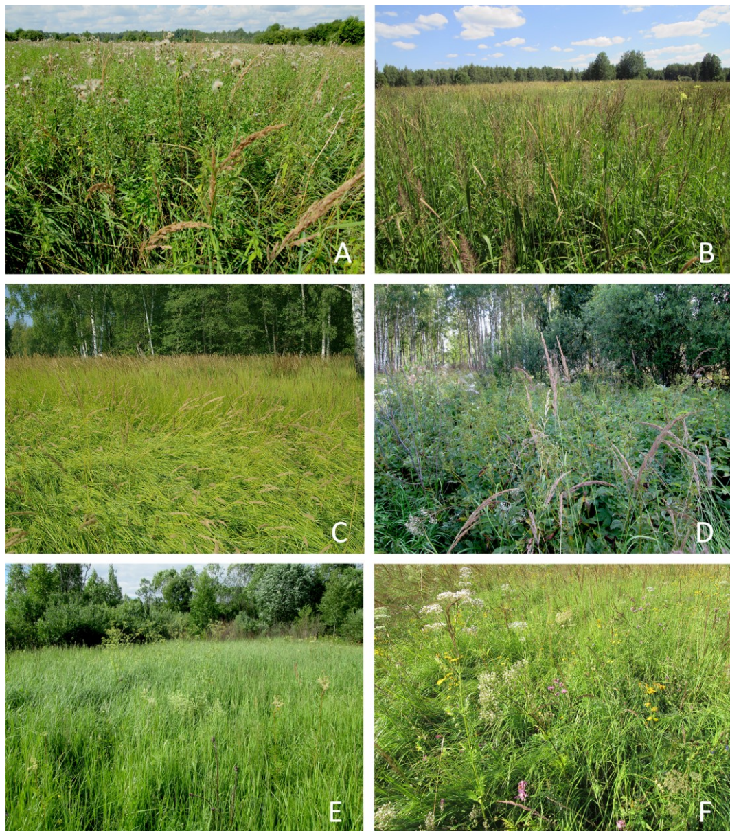
Рис. 2. Наземнейниковые луга на территории охранной зоны Полистовского заповедника.

A – асс. Convolvulo arvensis–Elytrigietum repentis C. epigeios var., B – асс. Calamagrostietum epigeji Trifolium medium var., C – асс. Calamagrostietum epigeji inops var., D – асс. Filipendulo ulmariae–Geranietum palustris C. epigeios var., E – асс. Angelico sylvestris–Cirsietum palustris C. epigeios var., F – асс. Selino carvifoliae–Molinietum caeruleae C. epigeios var.