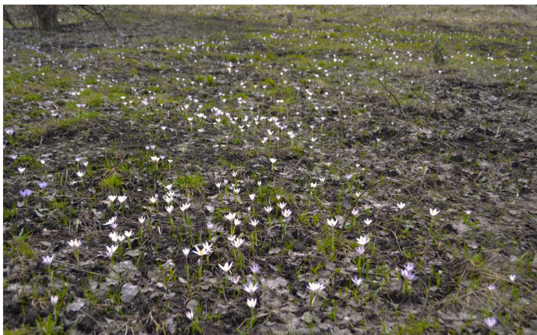
Рис. 2. Ценопопуляция Crocus reticulatus между сёлами Шекаловка и Волкодав. Fig. 2. Coenopopulation of Crocus reticulatus between Shekalovka and Volkodav.