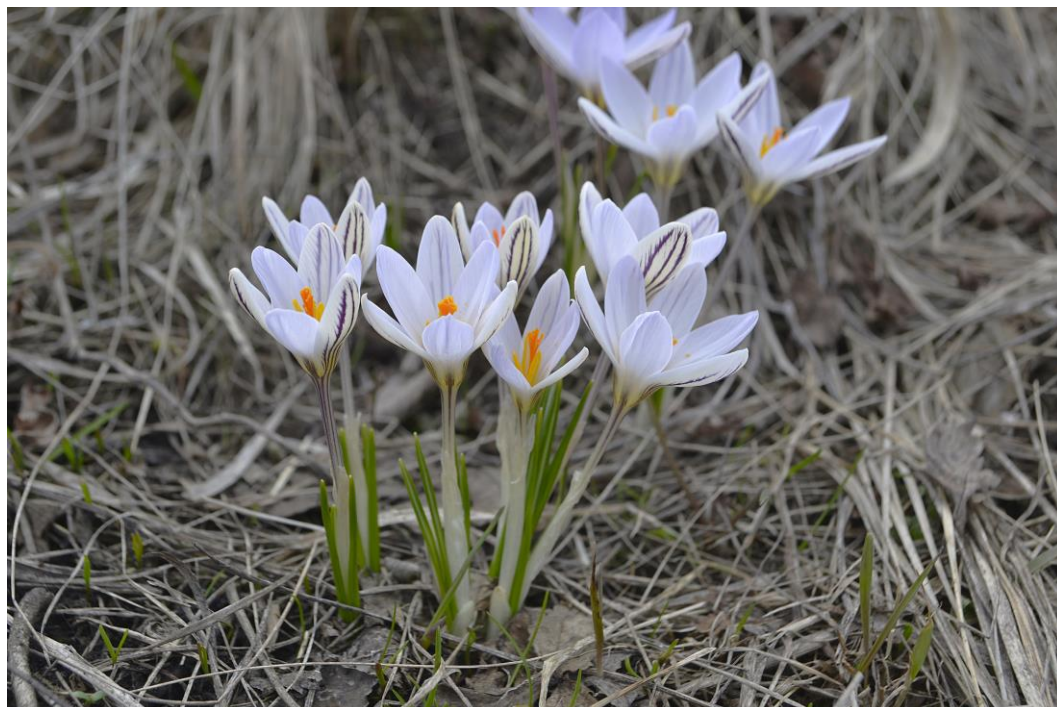
Рис. 1. Общий вид Crocus reticulatus . Fig. 1. Habit view of the Crocus reticulatus .