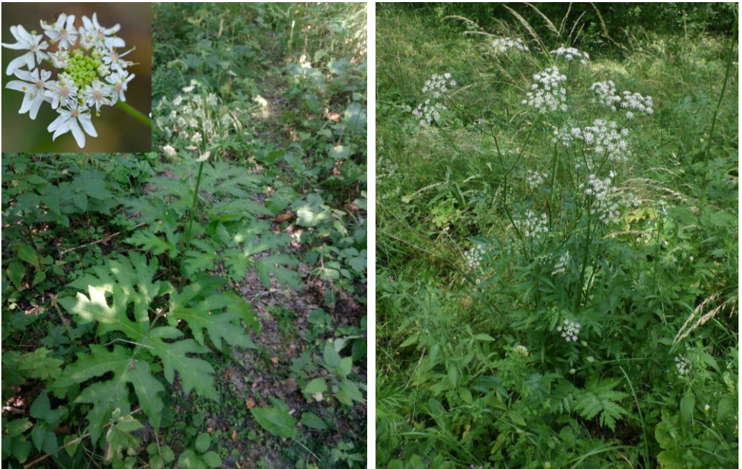
Рис. 2. Виды-полемохоры на территории памятника природы «Зеленинский лес»: Heracleum sphondylium L. (слева), Pimpinella major (L.) Huds. (справа).