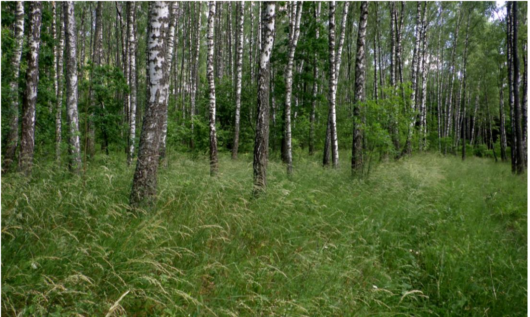
Рис. 1. Arrhenatherum elatius (L.) J. et C. Presl доминирует в травяном покрове светлого березняка, памятник природы «Зеленинский лес».