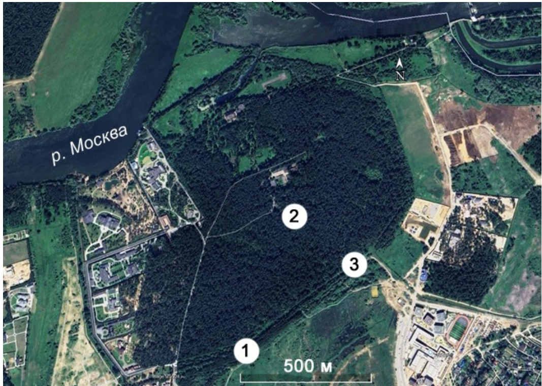
Рис. 1. Пункты сбора лишенологических материалов. Обозначения в тексте.

Пункты сборов: 1 – 14 квартал, N 55°45'23", E 37°18'20", полоса опушечного березняка и молодого осинника, далее – сложный сосняк; 2 – 15 квартал, N 55°45'45", E 37°18'34", широколиственный лес; 3 – там же, N 55°45'38", E 37°18'50", молодой осинник на опушке.